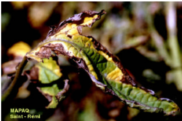
Photo 1 : Chancre bactérien sur la bordure de la feuille de tomate

Au champ , la bordure des feuilles brunit ce qui ressemble à une carence en potassium. Bien souvent, le chancre bactérien est confondu avec la brûlure alternarienne qui envahit les lésions. Les feuilles du bas roulent vers le bas et celles du haut vers le haut. Le plant entier finit par brunir et se dessécher (photo 1). À l'intérieur des tiges, le système vasculaire est brun. Tout comme pour le mildiou des chancres bruns envahissent l'extérieur des tiges. Les symptômes sur les fruits sont caractéristiques mais moins fréquents : tache blanche (3 à 6 mm) avec un centre brun foncé qui a l'apparence d'un œil d'oiseau (photo 2).